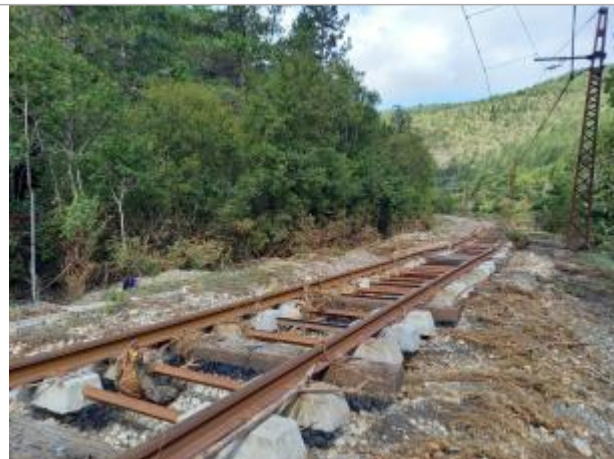
Vue du site, auteur: OTEIS, 2023

Coordonnées WGS84 : X: 3.18002800 / Y: 43.79896390