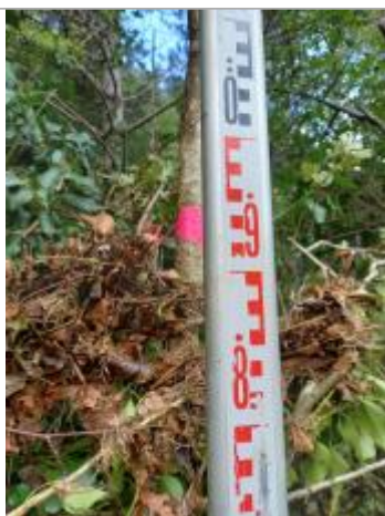
Vue du repère, auteur: OTEIS, 2023