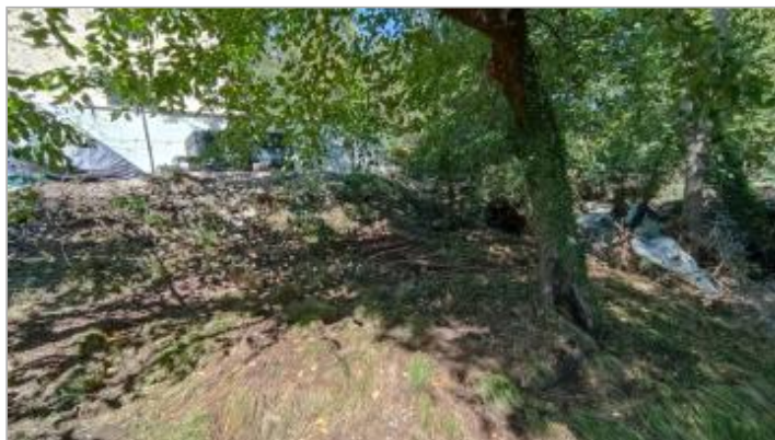
Vue du site, auteur: OTEIS, 2023

Coordonnées WGS84 : X: 3.19291190 / Y: 43.75623270