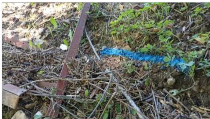
Vue du repère, auteur: OTEIS, 2023