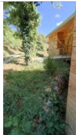
Vue du site, auteur: OTEIS, 2023

Coordonnées WGS84 : X: 3.20139260 / Y: 43.76340360