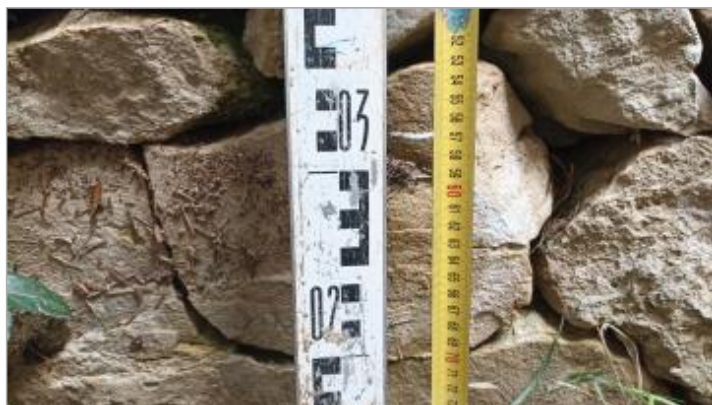
Vue du repère, auteur: OTEIS, 2023