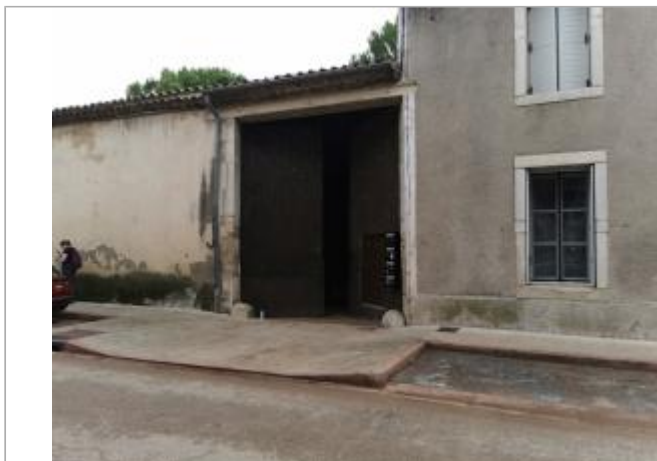
Vue du site, auteur: OTEIS, 2023

Coordonnées WGS84 : X: 3.73289900 / Y: 43.79159520