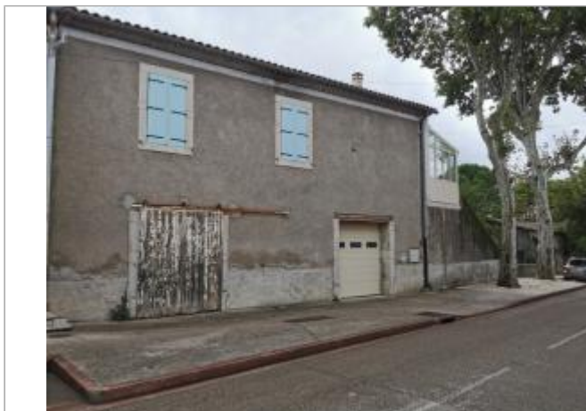
Vue du site, auteur: OTEIS, 2023

Coordonnées WGS84 : X: 3.73312880 / Y: 43.79222230