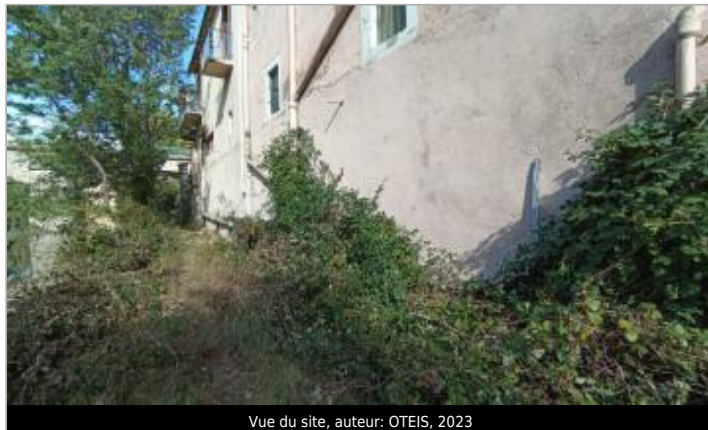
Vue du site, auteur: OTEIS, 2023

Coordonnées WGS84 : X: 3.32403280 / Y: 43.72794290