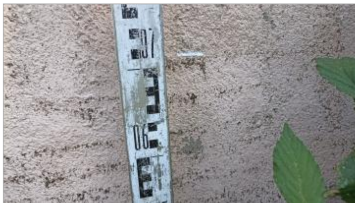
Vue du repère, auteur: OTEIS, 2023