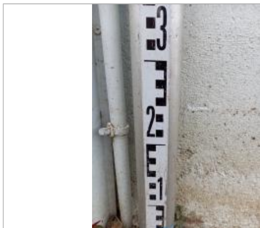
Vue du repère, auteur: OTEIS, 2023