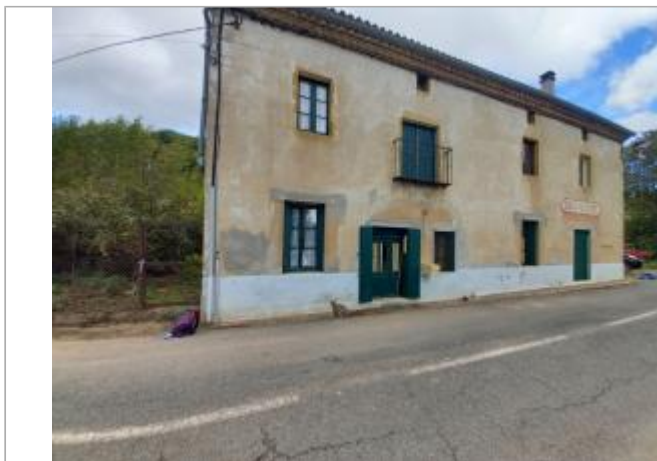
Vue du site, auteur: OTEIS, 2023

Coordonnées WGS84 : X: 3.15381630 / Y: 43.81256780