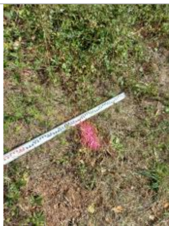
Vue du repère, auteur: OTEIS, 2023