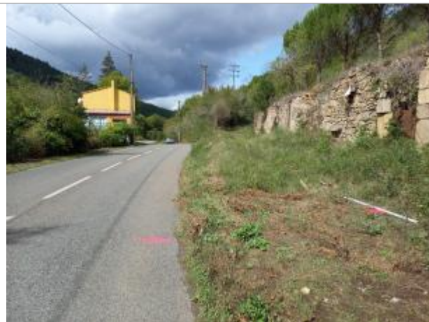
Vue du site, 2023

Coordonnées WGS84 : X: 3.17582040 / Y: 43.80228950