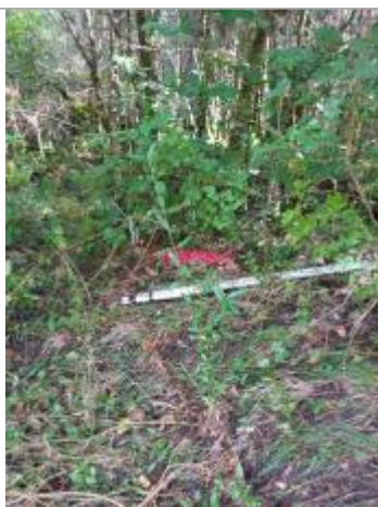
Vue du repère, auteur: OTEIS, 2023

Altitude calculée de l'eau (en m) : 498.227