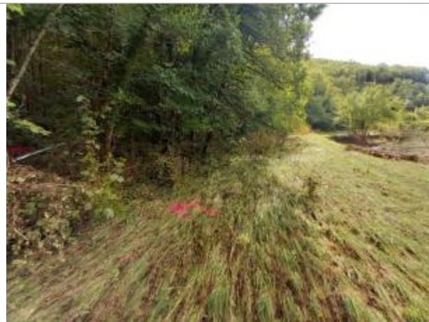
Vue du site, auteur: OTEIS, 2023