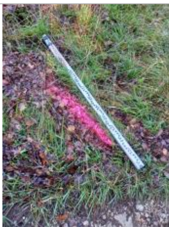
Vue du repère, auteur: OTEIS, 2023