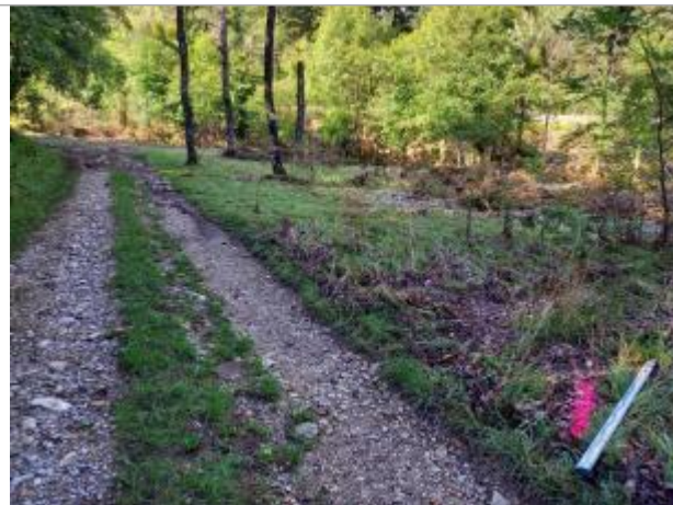
Vue du site, auteur: OTEIS, 2023