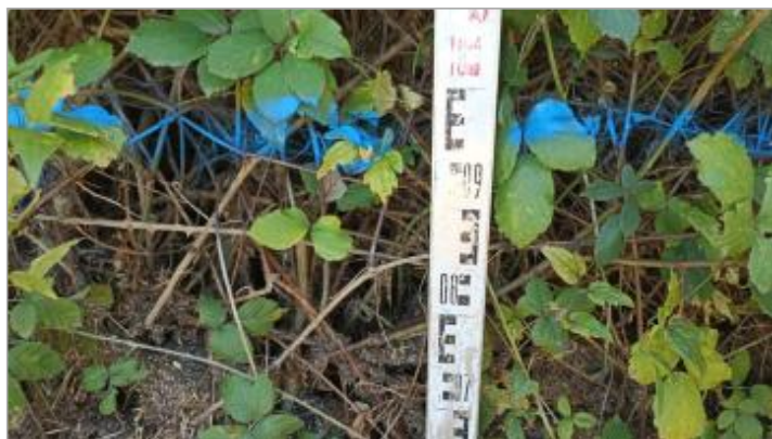
Vue du repère, auteur: OTEIS, 2023