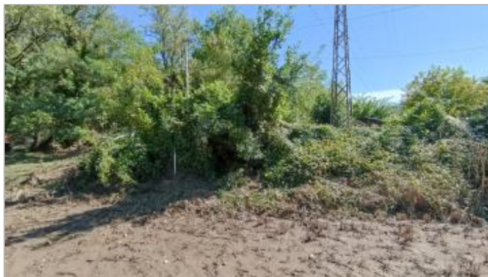
Vue du site, auteur: OTEIS, 2023