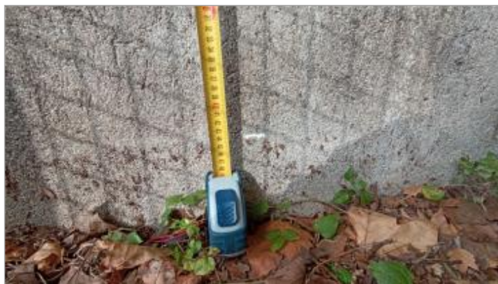
Vue du repère, auteur: OTEIS, 2023