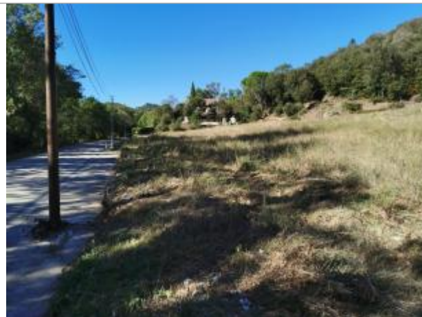
Vue du site, 2023

Coordonnées WGS84 : X: 3.16883690 / Y: 43.70604920