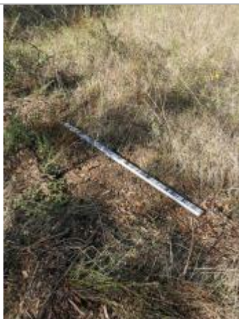
Vue du repère, auteur: OTEIS, 2023