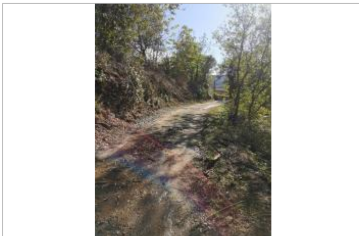
Vue du site, auteur: OTEIS, 2023

Coordonnées WGS84 : X: 3.17132460 / Y: 43.71156780