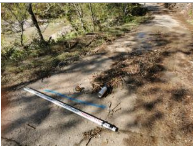
Vue du repère, auteur: OTEIS, 2023

Altitude calculée de l'eau (en m) : 259.461