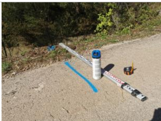
Vue du rep re, auteur: OTEIS, 2023

Altitude calcul e de l'eau (en m) : 258.903