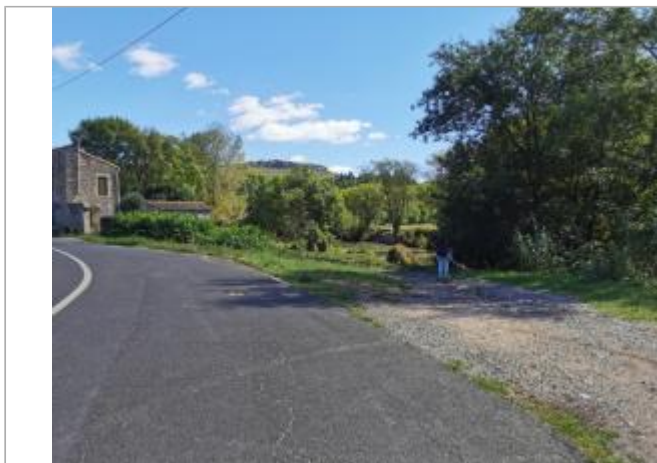
Vue du site, 2023

Coordonnées WGS84 : X: 3.15811730 / Y: 43.61987910