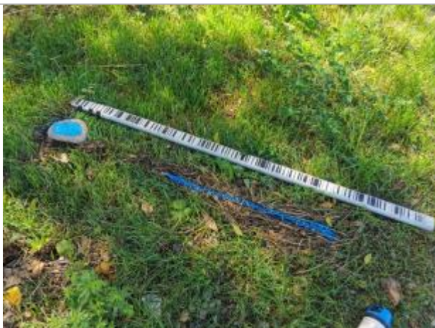
Vue du repère, auteur: OTEIS, 2023

Altitude calculée de l'eau (en m) : 196.625