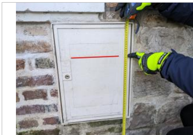
trace sur compteur

Altitude calculée de l'eau (en m) : 21.062 m