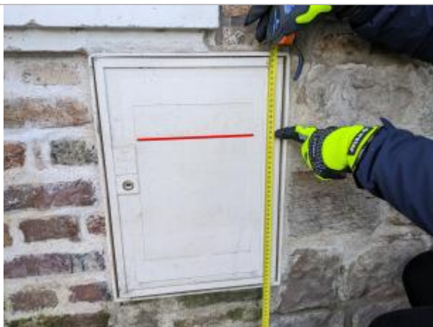
trace sur compteur

Altitude calculée de l'eau (en m) : 21.062 m