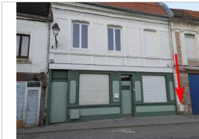
façade et compteur