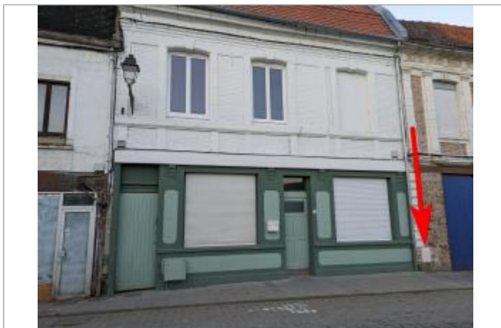
façade et compteur