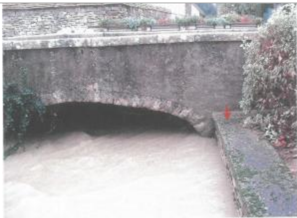
Photo du site - La flèche indique le point du nivellement de référence