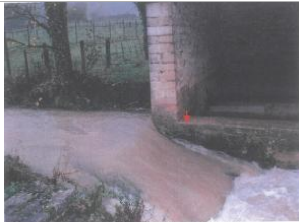
Photo du site - La flèche indique le point de nivellement de référence