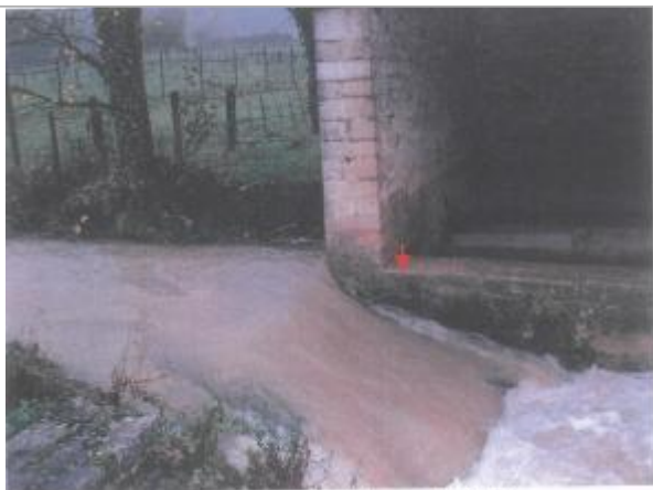
Photo du site - La flèche indique le point de nivellement de référence