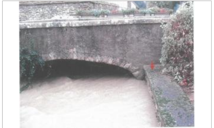
Photo du site - La flèche indique le point du nivellement de référence