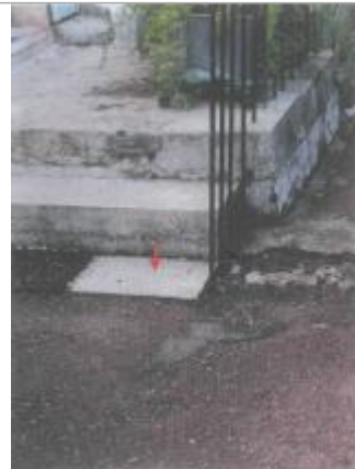
Photo du site (La flèche indique le point de nivellement de référence)