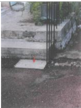
Photo du site (La flèche indique le point de nivellement de référence)