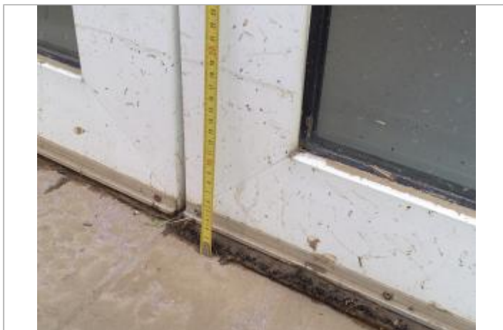
19 cm en partant du seuil de la porte