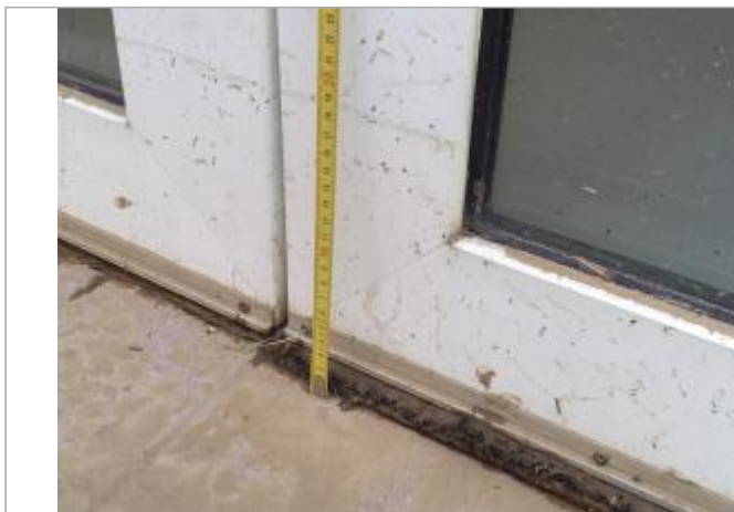
19 cm en partant du seuil de la porte