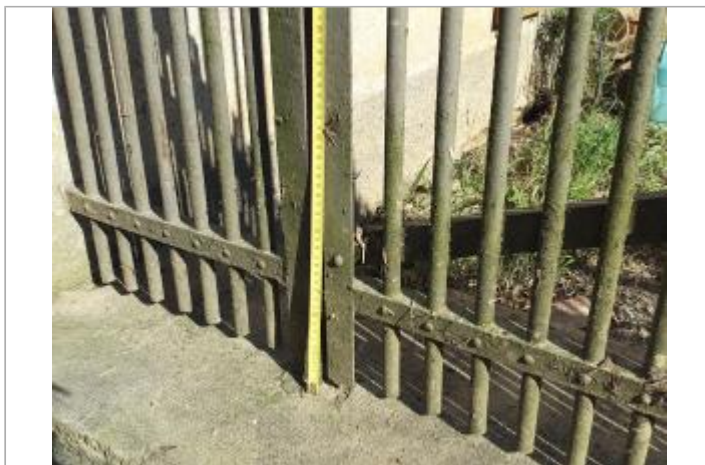
33 cm à partir du seuil en béton