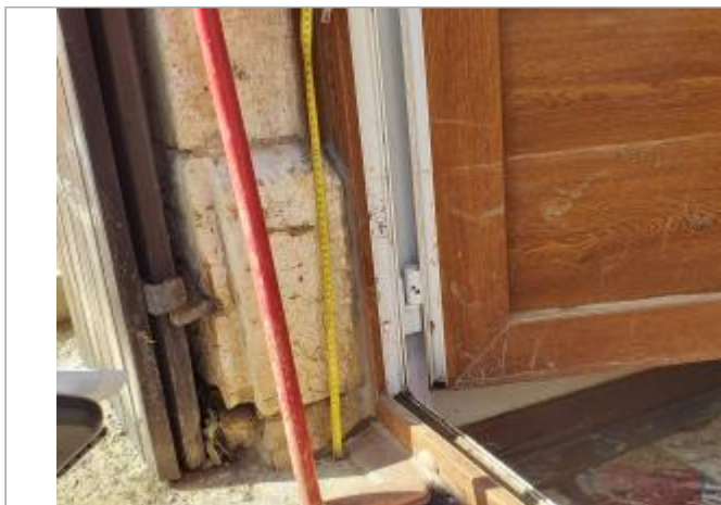
35 cm à partir de la jointure de porte