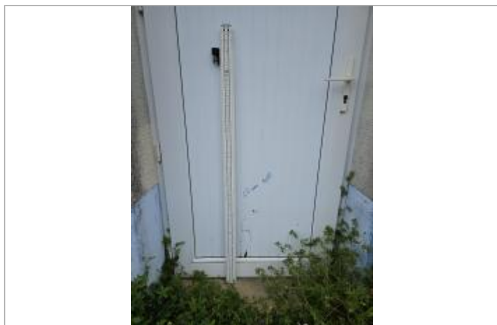
marque sur la porte

SOURCE DE REPÉRAGE : CAMPAGNE LAISSES DE CRUE AA NOVEMBRE 2023 - 07/11/2023