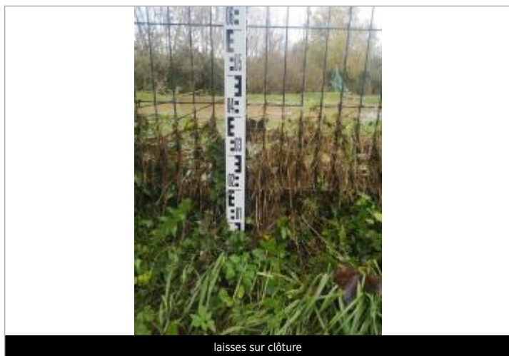
laises sur clôture

Altitude calculée de l'eau (en m) : 76.029 m