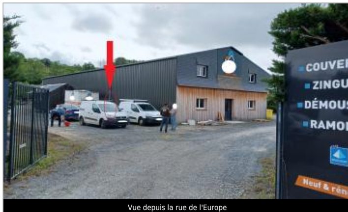
Vue depuis la rue de l'Europe