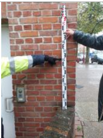
Vue de la marque

Altitude calculée de l'eau (en m) : 8.64