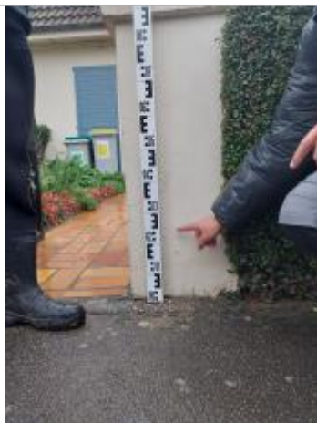
Vue de la marque

Altitude calculée de l'eau (en m) : 11.58 m