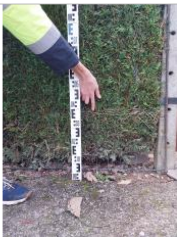
Vue de la marque

SOURCE DE REPÉRAGE : SPC SMYL - 21/01/2020