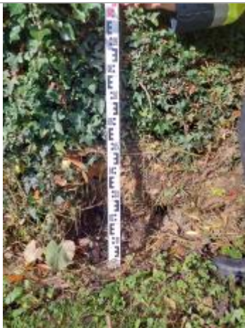
Vue de la marque

Altitude calculée de l'eau (en m) : 63.69 m