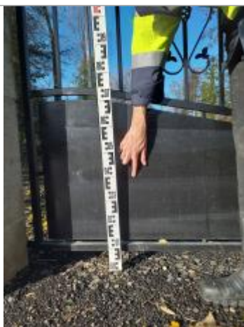
Vue de la marque

SOURCE DE REPÉRAGE : SPC SMYL - 21/01/2020