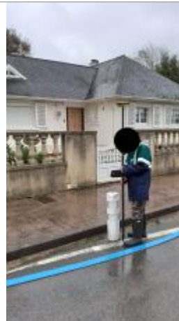
plot face au n°21