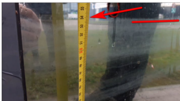
repère sur façade

SOURCE DE REPÉRAGE : CAMPAGNE LAISSES DE CRUES LIANE NOVEMBRE 2023 - 08/11/2023