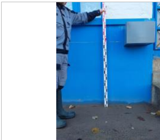
Vue de la marque

Différence entre le niveau d'eau et la référence (en m) : 1.100 m