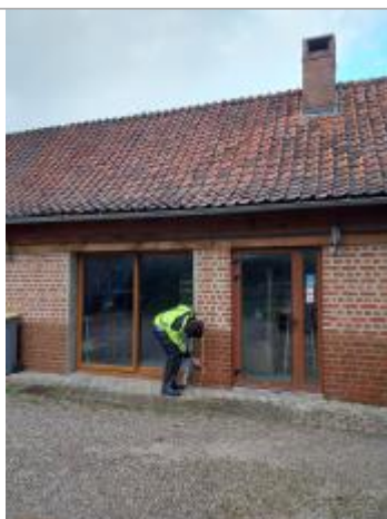
Vue de la marque

Différence entre le niveau d'eau et la référence (en m) : 0.900 m