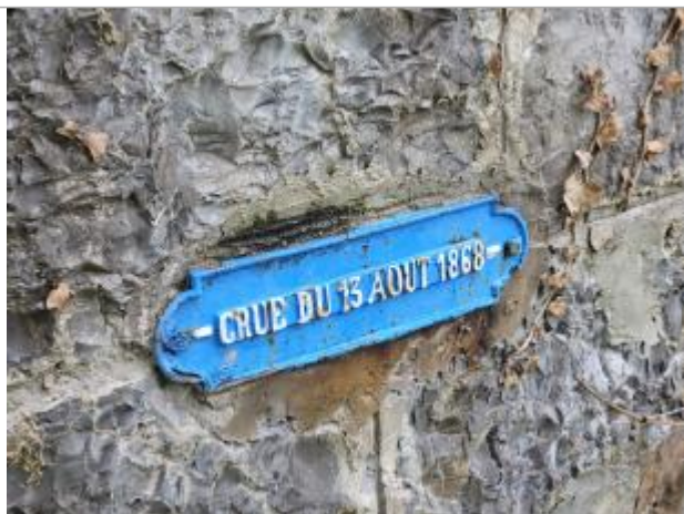
Repère scellé représentant la crue du 13/08/1868