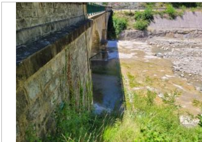
Rive droite, à l'aval du pont de la RD61 rejoignant la RD94.

Coordonnées WGS84 : X: 5.34925889 / Y: 44.41016570