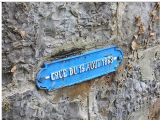
Repère scellé représentant la crue du 13/08/1868