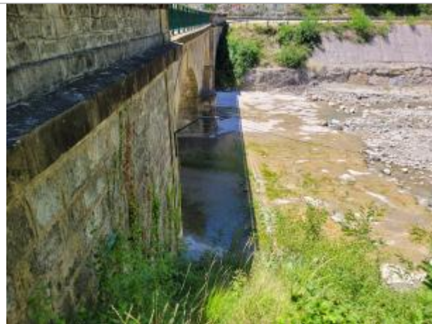
Rive droite, à l'aval du pont de la RD61 rejoignant la RD94.