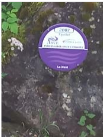
Passerelle sous le cimetière