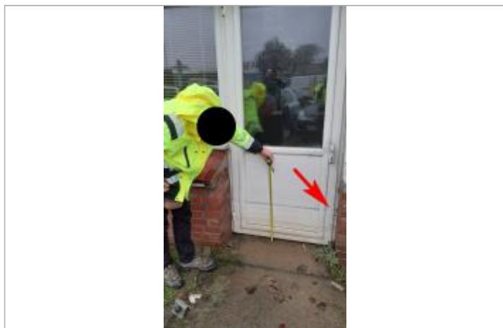
marque sur la porte

Altitude calculée de l'eau (en m) : 6.18 m