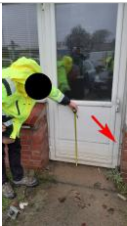
marque sur la porte

Altitude calculée de l'eau (en m) : 6.18