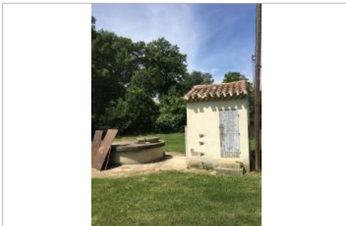
vue du sites avec les différents repères