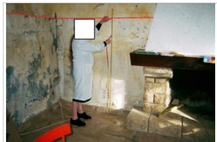
Laisse de l'inondation de janvier 2001 sur le mur intérieur de la pharmacie

GÉNÉRAL Code : BI08_Inzinzac-Lochrist_2001 Date de mise à jour : 27/05/2025 Auteur : SPC VCB