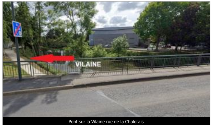
Pont sur la Vilaine rue de la Chalotais

Coordonnées WGS84 : X: -1.60043390 / Y: 48.11727300