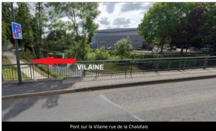
Pont sur la Vilaine rue de la Chalotais