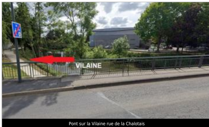
Pont sur la Vilaine rue de la Chalotais