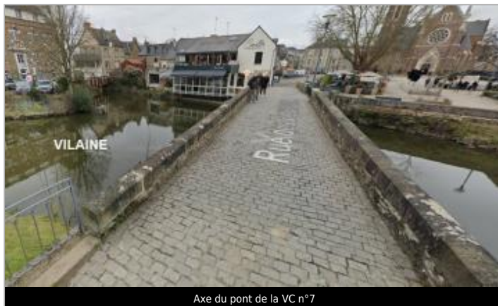
Axe du pont de la VC n°7