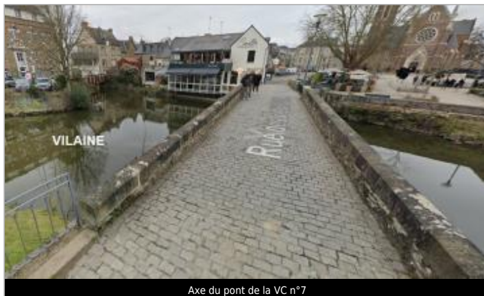
Axe du pont de la VC n°7