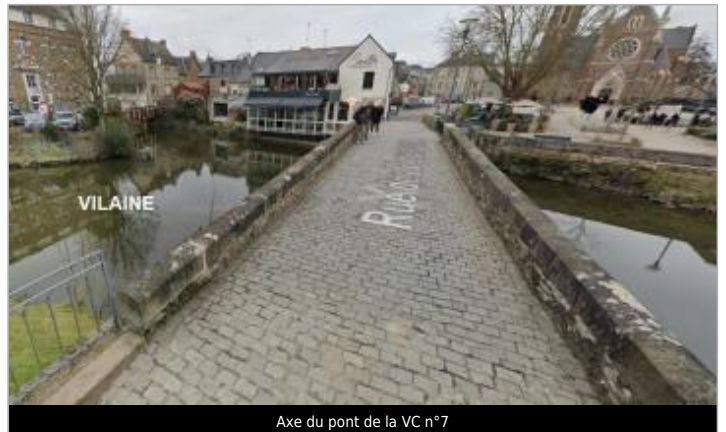
Axe du pont de la VC n°7

Coordonnées WGS84 : X: -1.60432807 / Y: 48.11618520