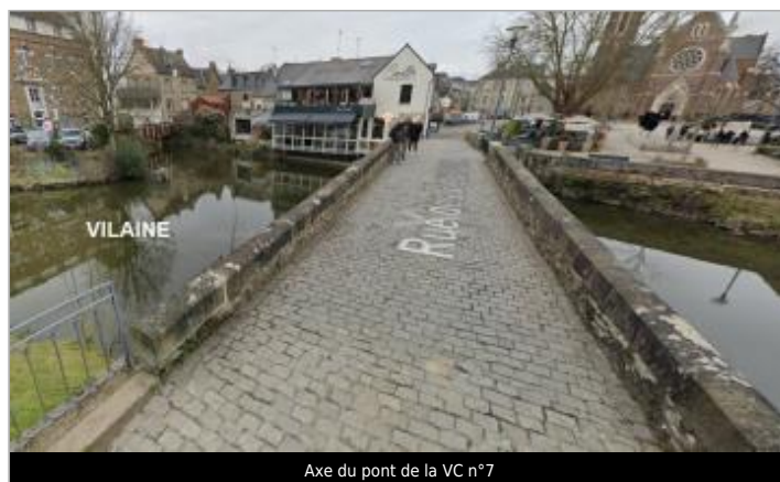
Axe du pont de la VC n°7

GÉOLOCALISATION Coordonnées WGS84 : X: -1.60432807 / Y: 48.11618520 Coordonnées RGF93 (Lambert 93) X: 357558.1 / Y: 6789521.7 Coordonnées RGF93 (ETRS89) : X: -1.6043281 / Y: 48.1161852 Code Hydro: J---0060 Rive de référence: