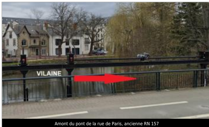
Amont du pont de la rue de Paris, ancienne RN 157