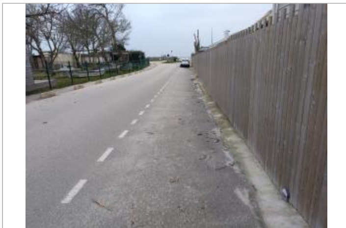
Landrezac à Sarzeau

GÉOLOCALISATION Coordonnées WGS84 : X: -2.71024115 / Y: 47.50550860 Coordonnées RGF93 (Lambert 93) X: 270534 / Y: 6727218 Coordonnées RGF93 (ETRS89) : X: -2.7102412 / Y: 47.5055086 Code Hydro: _OATLANT Rive de référence: