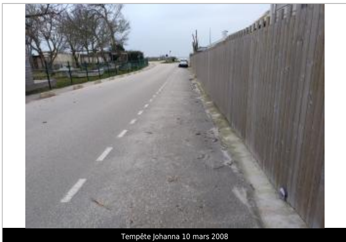
Tempête Johanna 10 mars 2008

MARQUE Maximum de l'inondation : Oui Visibilité : Oui État du repère : Bon Pérennité : Longue Repère calculé : Non PHEC : Oui